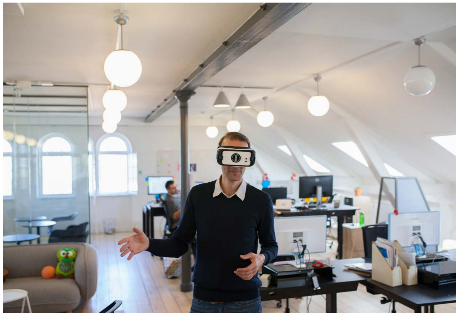
Med laboratoriet i telefonen Labster er en av de mange start-up-virksomhetene som har slått seg ned i den gamle «bekledningsfabrikken» i bydel Christianshavn, et steinkast fra hippe Papirøen og to tre fra Københavsoperaen. Det unge firmaet har utviklet en laboratoriesimuleringsteknologi og samarbeider med 150 universiteter og andre læresteder verden over. Laboratoriene får alle plass i telefonen som kan settes inn i en VR-brille, og vips er man på jobb.