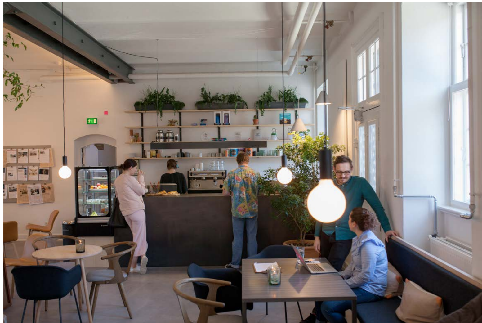
Friløst for plattformer Kafeen i inngangspartiet i den gamle «bakedningsfabrikken» i bydel Christianshavn som er blitt inkubasjonssted for en rekke gründervirksomheter er én av flere uformelle møteplasser for de nystartede nettbaserte bedriftene.