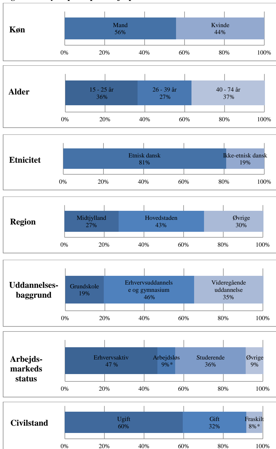
Figur 1: Udbyderprofil på arbejdsplatformene i Danmark

Omkring 42.000 danskere i alderen 15-74 år har i løbet af de seneste 12 måneder tjent penge via en arbejdsplatform. I figuren nedenfor tegnes der en demografisk profil af denne gruppe af danskere.